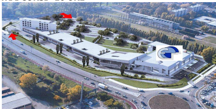
Il Direzionale VOLO

L' EFPE è raggiungibile per mezzo del tram , sia dalla stazione ferroviaria sia dalla stazione autobus, con frequenza ogni 8 minuti, per mezzo della Linea E del Minibù.